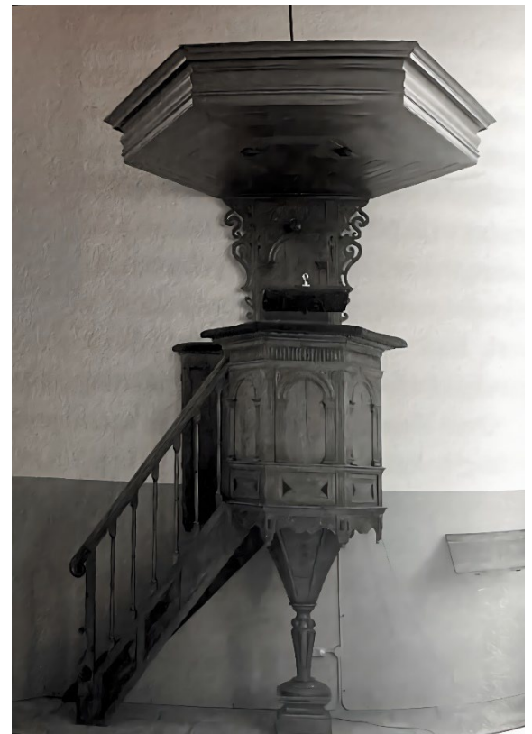
Preekstoel in Hollandse renaissancestijl eerste helft 17 e eeuw