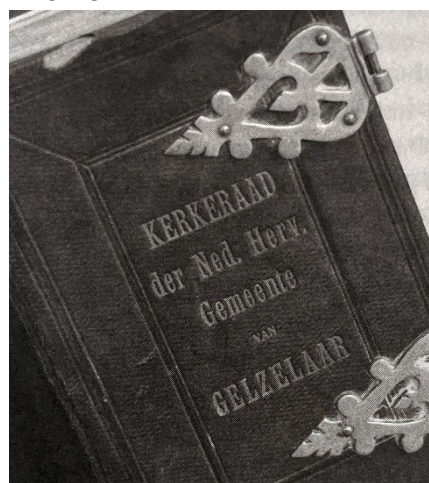
Bijbel in Statenvertaling met opdruk