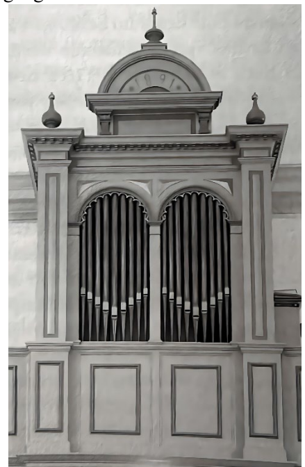
Het orgel uit 1891, afkomstig van orgelbouwer fa. Leichel uit Lochem

Dispositie: Prestat 8 " Holpijp 8 " Octaaf 4 " Mixtuur Pedaal:Subbas 16 " Koppeling