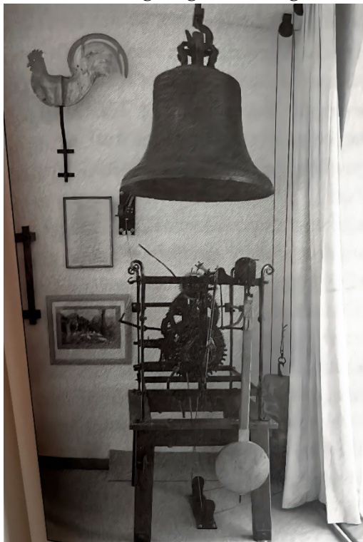
De luidklok uit 1631 en het uurwerk uit 1632 op de galerij bij het orgel