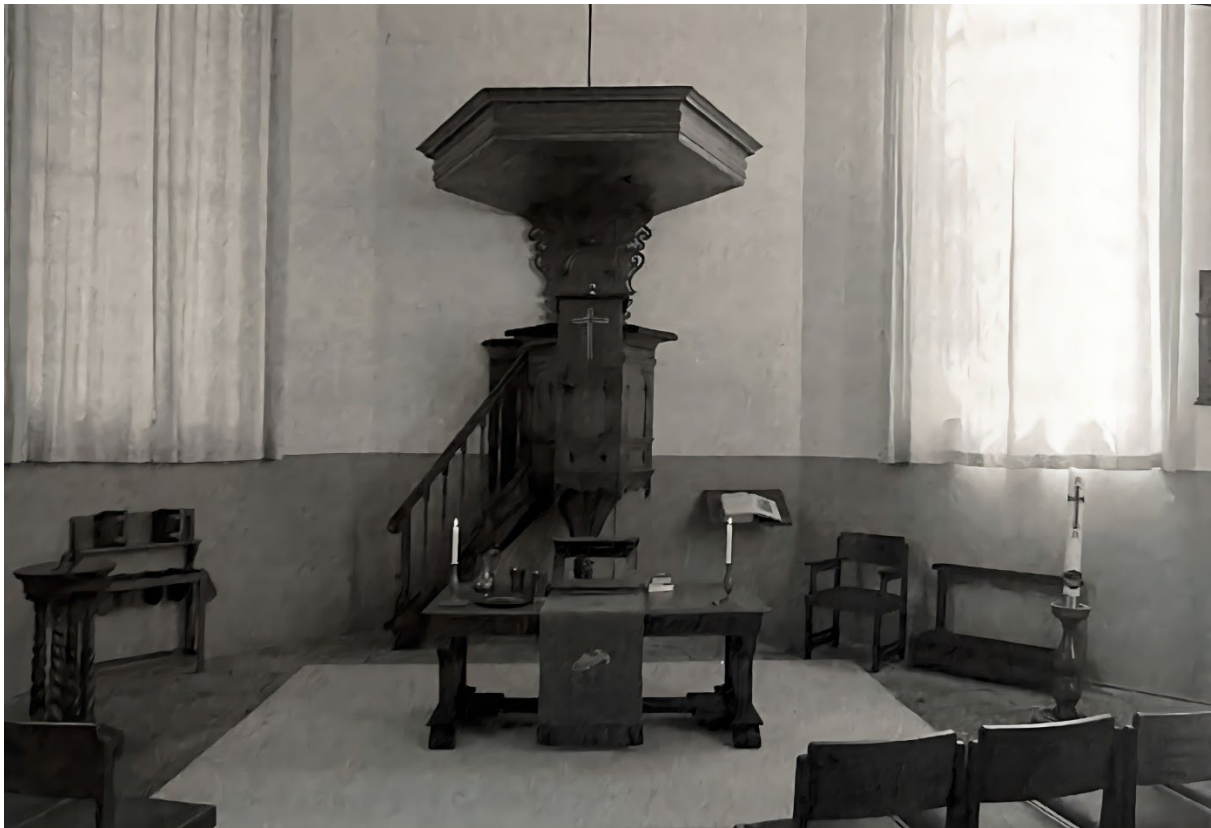
Liturgisch centrum met links de doopvont en rechts de kerkbijbel en de paarskaars