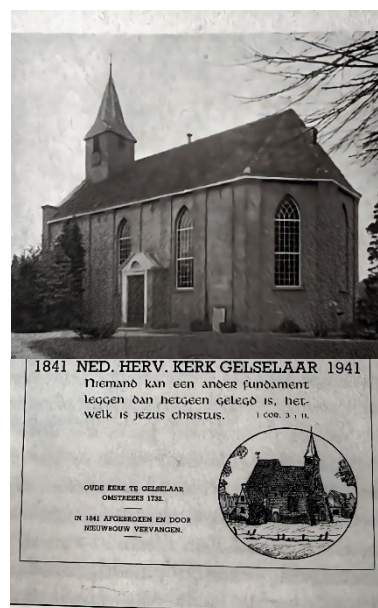
Herdenkingsplaat bij gelegenheid van het 100 jarig bestaan van het kerkgebouw in 1941

vanaf ds. J. ter Meulen (1797-1837) tot en met ds. H.D.J. Boissevain (1905-1920). Er bestaan momenteel plannen om dit 'fotografisch overzicht' weer bij de tijd te brengen door de rij