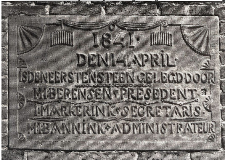
FOTO'S VAN BEIDE GEDENKSTENEN, boven de zuidelijke muur, rechts de westelijke torenmuur

Het gebouw is een zogeheten 'Waterstaatskerk' zoals er in de 19 de eeuw wel meerdere gebouwd zijn. Deze benaming houdt verband met het gegeven dat de bouw van de kerk onder auspiciën van ingenieurs van Rijkswaterstaat uitgevoerd werd. De stijl van dit soort kerken, herkenbaar onder andere aan de gietijzeren ramen, de strakke lijnen en de zakelijke opzet, noemt men om deze reden 'waterstaatsstijl'. De waardering voor deze stijl is in de loop der tijden niet altijd even positief geweest, getuige de weinig vleierende zeggwijze 'Wat er staat is waterstaat'. Bij gelegenheid van het 350-jarig bestaan van de Hervormde Gemeente Gelselaar in 1967 schreef een journalist in de plaatselijke krant daarom misschien wel: "In tegenstelling tot de meeste andere waterstaatskerkjes is die van Gelselaar wat architectuur en stijl betreft zeker geslaagd". Laat het maar gezegd zijn!