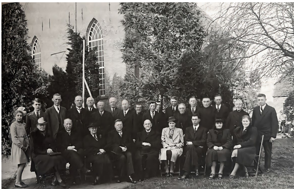
Foto na afloop herdenkingsdienst bij de viering van het honderdjarig bestaan in 1941