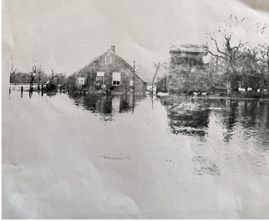
Beltman tijdens de overstroming