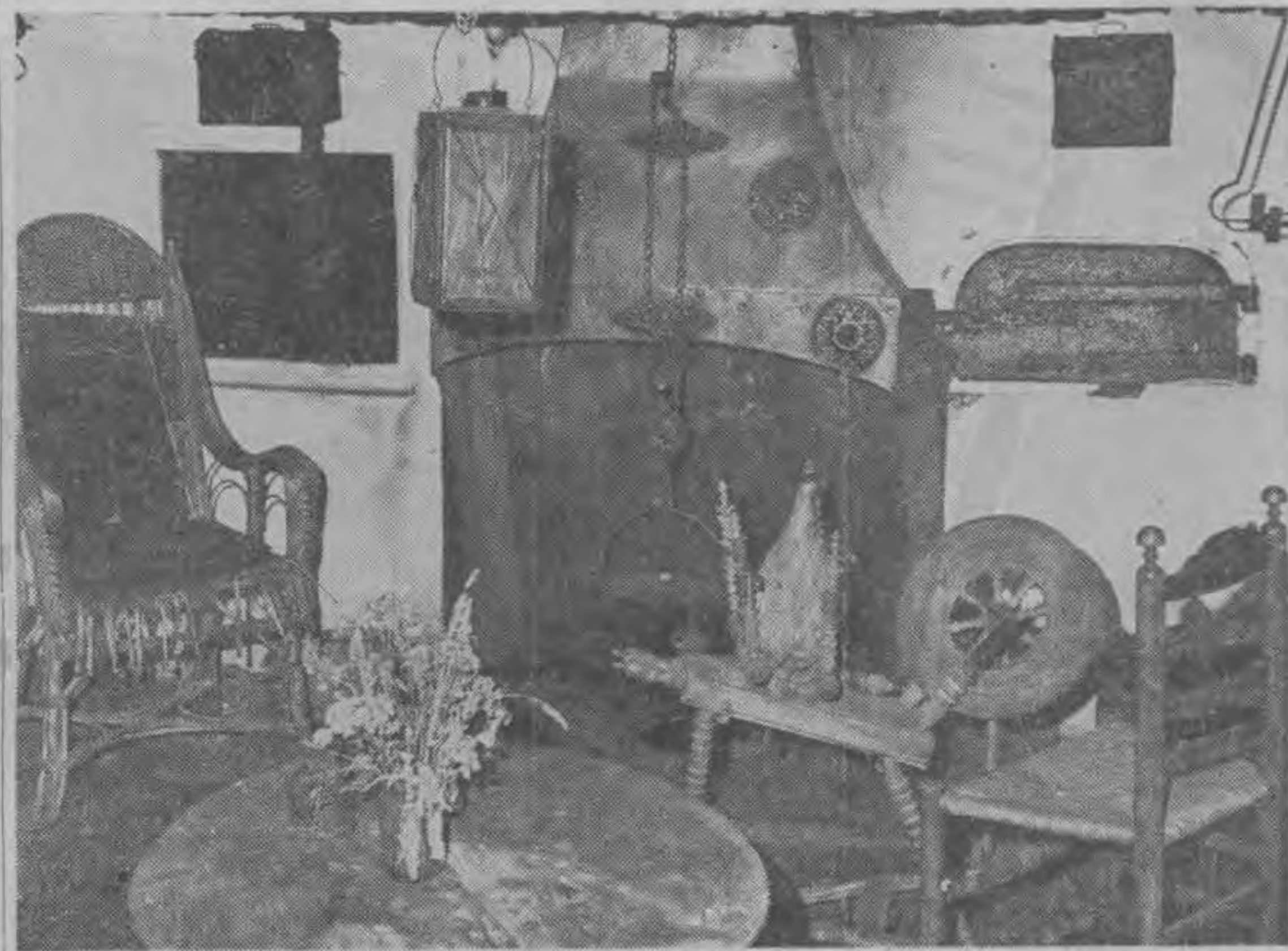
De laatste tijd is ook het bakhuis bij 't Renger weer ingericht zoals het vroeger eeuwen geweest moet zijn.

neuzen, koffiesmodden, origineel gebleekt en ongebleekt linnen in een monumentaal kabinet, oude portretten en meer van deze kostbaarheden.