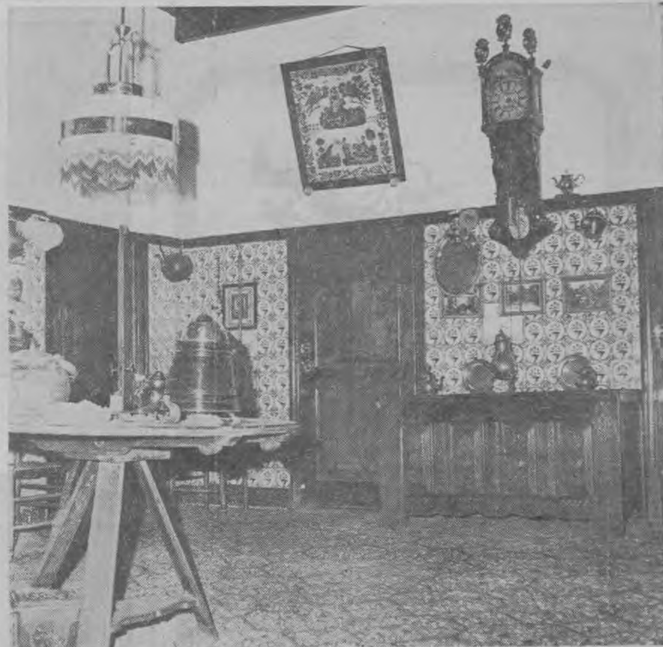
terhoeks boerderijen beter bewaard kan blijven.

Het is wel een vertrek om even stil van te worden. Niet alleen vanwege de werkelijk monumentale keltjesvloer, met daarin de vierkante en achthoekmotieven, maar vooral ook door de manshoge tegelwanden, de prachtige schouw (met vlak onder het trekgat van de schoorsteen twee engeltjes tegen de boze geesten) waarin ruim honderd fraaie tegeltjes evenzovele bijbelse tafelen weergegeven en de schat van wandborden, serviesgoed, snot-